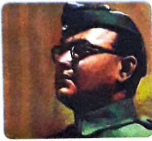
सुभाष चंद्र बोस